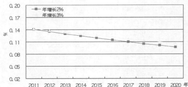
图 2 不同方案下浙江省残疾人护理津贴制度所需资金占财政收入比重